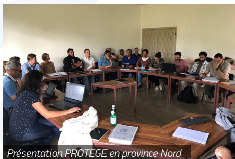
Présentation PROTEGE en province Nord

9 appels d'offres et contrats de service sont en cours parmi lesquels: mission expertise filière cocotier à WF, animation du réseau de