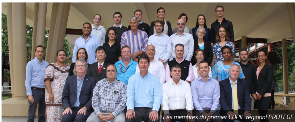
Les membres du premier COPIL régional PROTEGE

Le premier comité de pilotage régional, tenu les 17 et 18 juillet 2019 à Nouméa, a permis le lancement opérationnel de PROTEGE. Au niveau régional, les trois premiers ateliers du projet se dérouleront en novembre, sur les thèmes de l'Agriculture et de la foresterie ainsi que de la Pêche côtière et de l'aquaculture. PROTEGE finance également la participation de représentants des PTOM aux événements suivants: